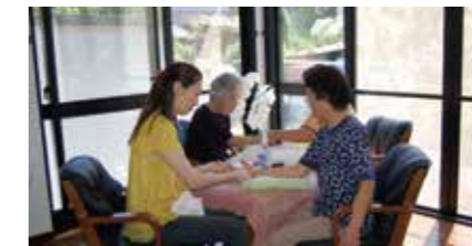
▲ 介護美容サロンでの技術は、高齢で皮膚の薄い方、身体の弱い方にも受けていただけるよう、アレンジしています。