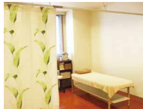
▲ ホーム内のフロアの一角にあるゆったりとしたサロンスペース

フロアの一角をお借りして、ホーム内の高齢者に足爪フットケアや着衣リンパケアを専門にサービスを行う介護美容サロン。「エクセレント」様内サロンは2008年のオープン以来「歩きやすくなった」「爪の痛みがなくなった」と好評。スタッフは全員ホリスケアアカデミー修了生です。