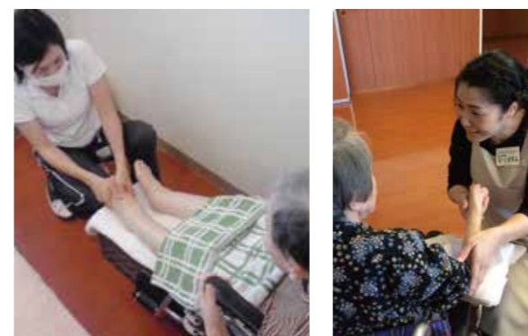
▲ フットケアで指やふくらはぎのむくみが解消して足が軽くなったり、ハンドケアで普段以上の笑顔を見せていただけたり