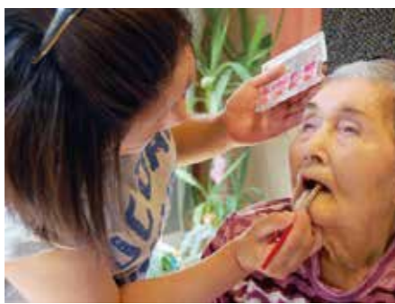
▲ 表情がグッと明るくなるメイクセラピーではご利用者様に普段以上の笑顔を見せて頂けます

トリートメントは血行も血色もよくなり、結果が出ます。むくみも取れ、手もつかみやすくなり、今後も、お手入れを続けて元気で歳を重ねて頂きたいと思います。