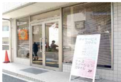
▲ 週に2回、ホリスケアビューティのスタッフが来ることを楽しみにいただいています