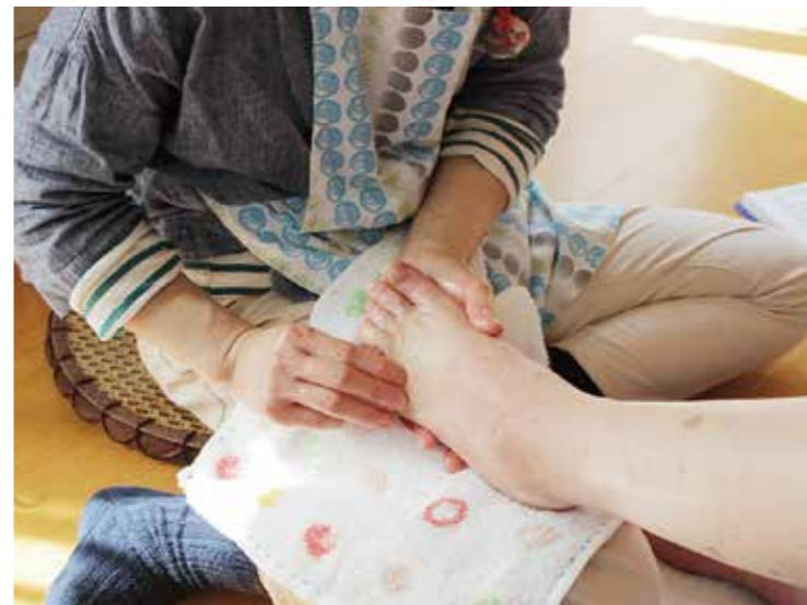
▲ フットケアで指やふくらはぎのむくみが解消して足が軽くなったり、メイクセラピーで普段以上の笑顔を見せていただけたり、多くの変化が確認できます。

2009年に開所した矢野の「ハースの家」様は、美容と健康をテーマにしたデイサービスです。フットケアや、ハンドケア、リンパケア・フェイシャルケアなどを、アロマテラピーを取り入れたリラックスした雰囲気で行います。