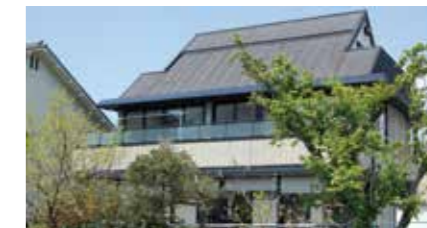
▲ 定員10名なので、心が通い合う穏やかな時間がゆったりと流れます